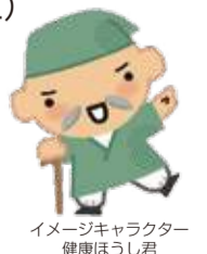
イメージキャラクター 健康ほうし君