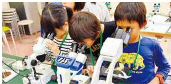
子ども達が参加できる科学教室「洋光台サイエンスクラブ」では、多彩なプログラムを用意しています。詳細は冊子。☎はまぎん こども宇宙科学館洋光台サイエンスクラブ担当 ☎832-1166 ☎832-1161

日本には科学館・科学博物館と名の付く施設は450程あるが、自治体や経営団体の財政状況を反映して、どこも非常に経営が苦しい。意見交換をすると決まって「予算が足りない」と悩みが吐露される。もちろん苦しいのは当館も例外ではない。しかし学