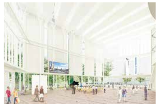
アトリウム完成イメージ

【この記事に関する問合せは】 総務局新市庁舎整備担当へ ☎ 633-3902 ☎ 664-2501