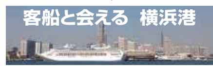
客船と会える 横浜港