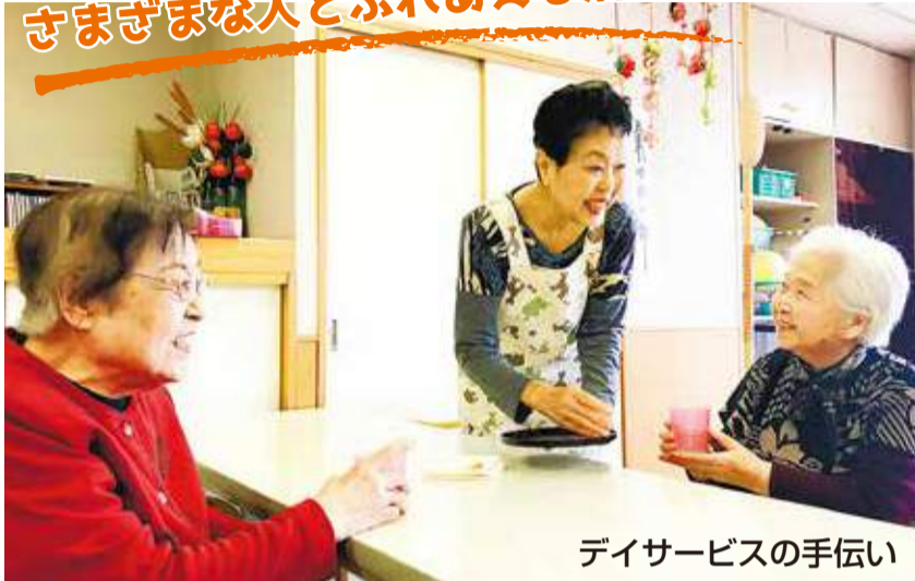
デイサービスの手伝い