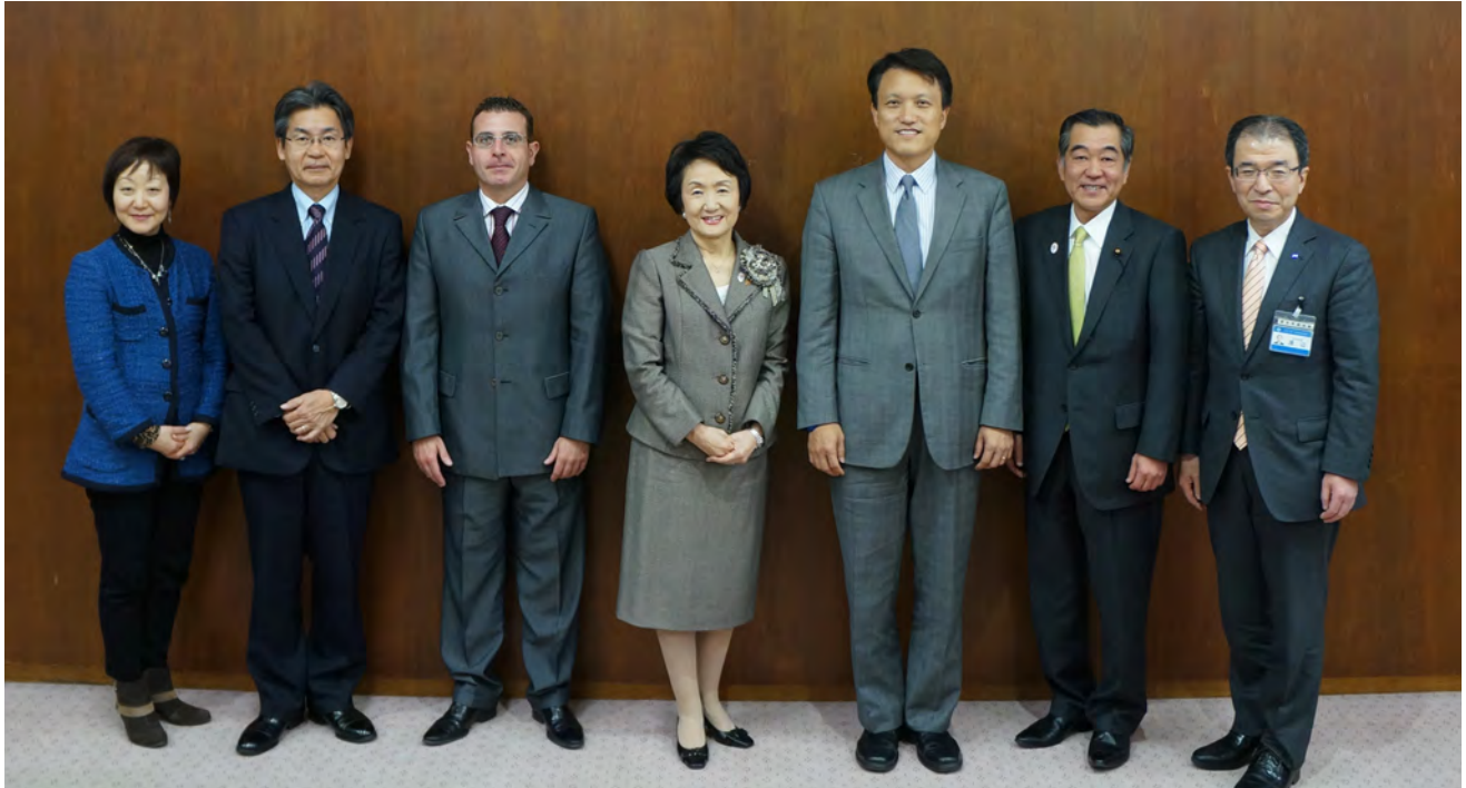
アジア開発銀行(ADB)による開催地評価視察