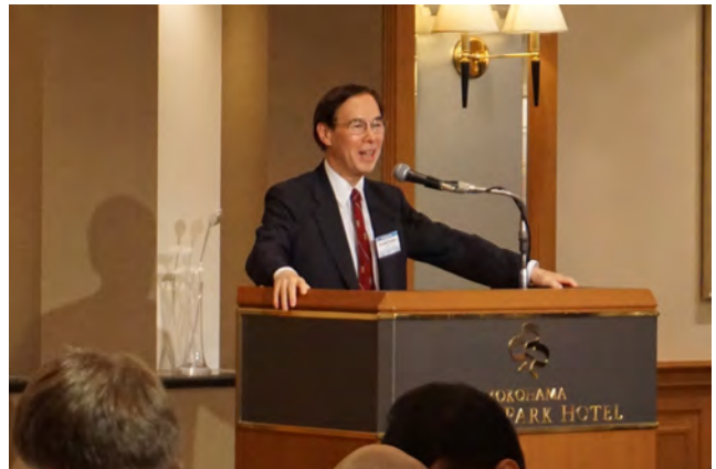
吉野直行アジア開発銀行研究所所長挨拶