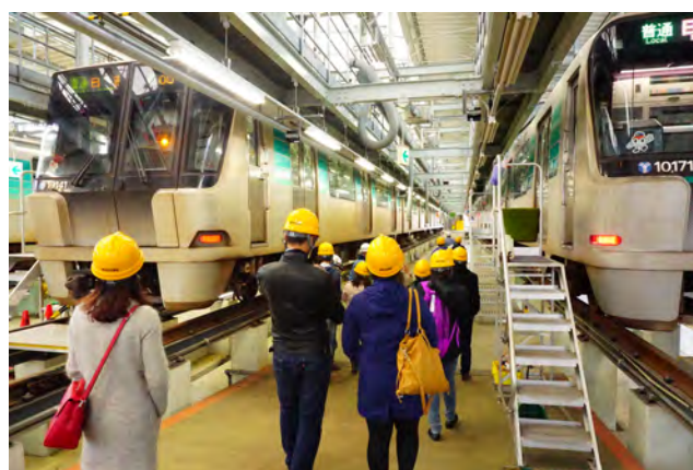
交通局川和車両基地視察