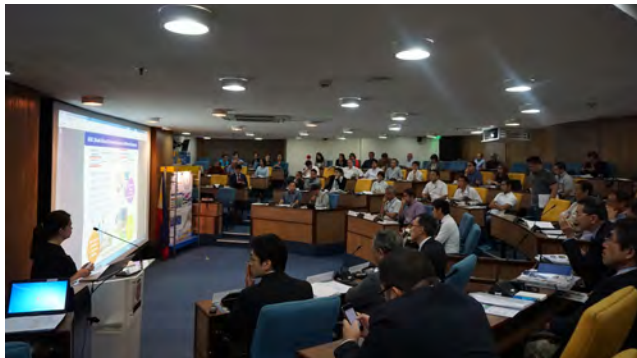
ビジネスマッチングセミナーでの意見交換(セブ都市圏)