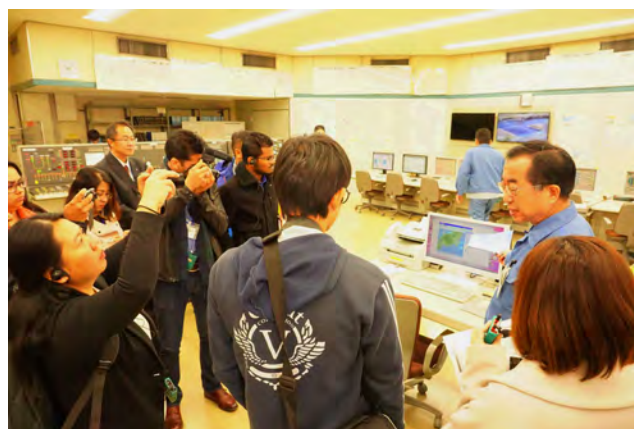
環境創造局港北水再生センター視察