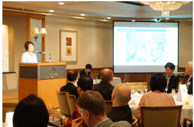
林市長のスピーチ

「都市の持続的な成長に向けて 横浜市の挑戦」 Y-PORT等、ADBとの連携による横浜市の国際協力や 女性活躍支援等について