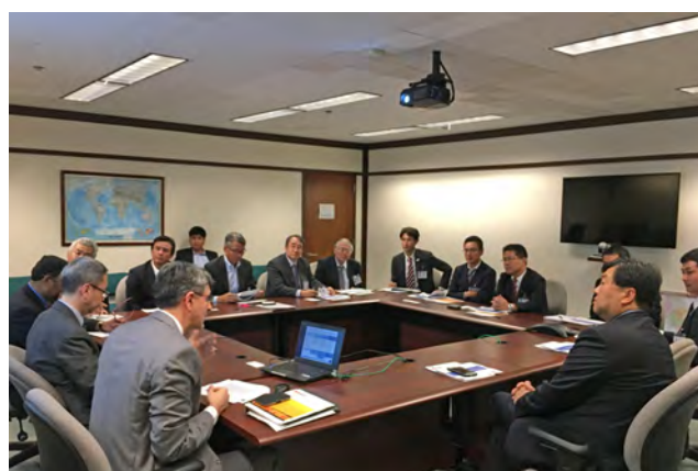
市内企業とADB幹部との意見交換(ADB本部・マニラ)

参加企業からは、「アジア進出にあたってADBが強力なパートナーとなりうることでよく理解できた」「ADBとコネクションができたので活用していきたい」等の感想が寄せられました。