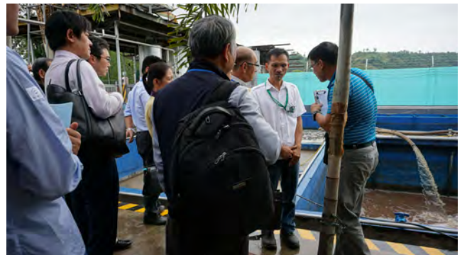
現地調査(カガヤン・デ・オロ)の様子