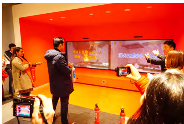
横浜市民防災センター視察