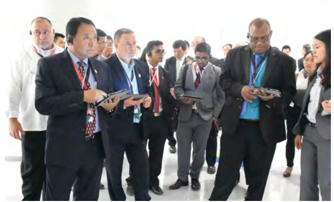
タブレット端末を使用した説明を受ける様子

上下水道、廃棄物処理、港湾の分野で、海外からの視察に対応するための受入環境整備を行いました。