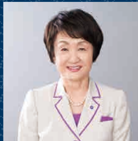
横浜市長 林 文子 Mayor of YOKOHAMA Fumiko Hayashi

2017年5月、横浜で開催された「第50回アジア開発銀行年次総会」には、101の国・地域から、本総会として過去最多となる約5千人の方が参加されました。