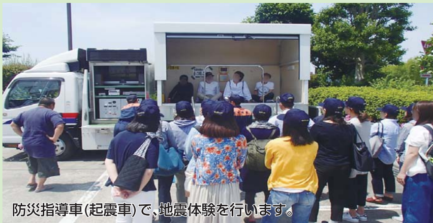
防災指導車(起震車)で、地震体験を行います。