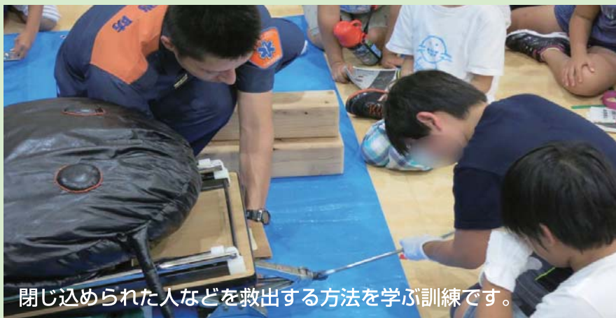
閉じ込められた人などを救出する方法を学ぶ訓練です。