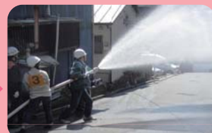
初期消火器具取扱訓練60分