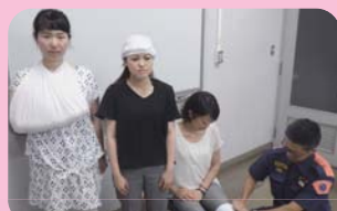
三角巾取扱訓練30分