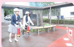
消火器取扱訓練20分