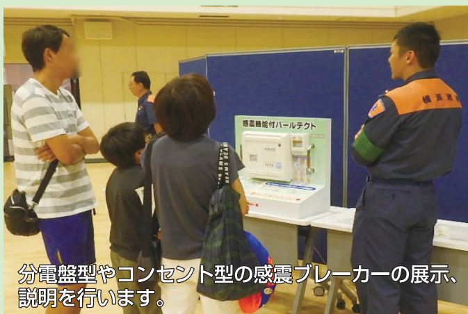
分電盤型やコンセント型の感震ブレーカーの展示、説明を行います。