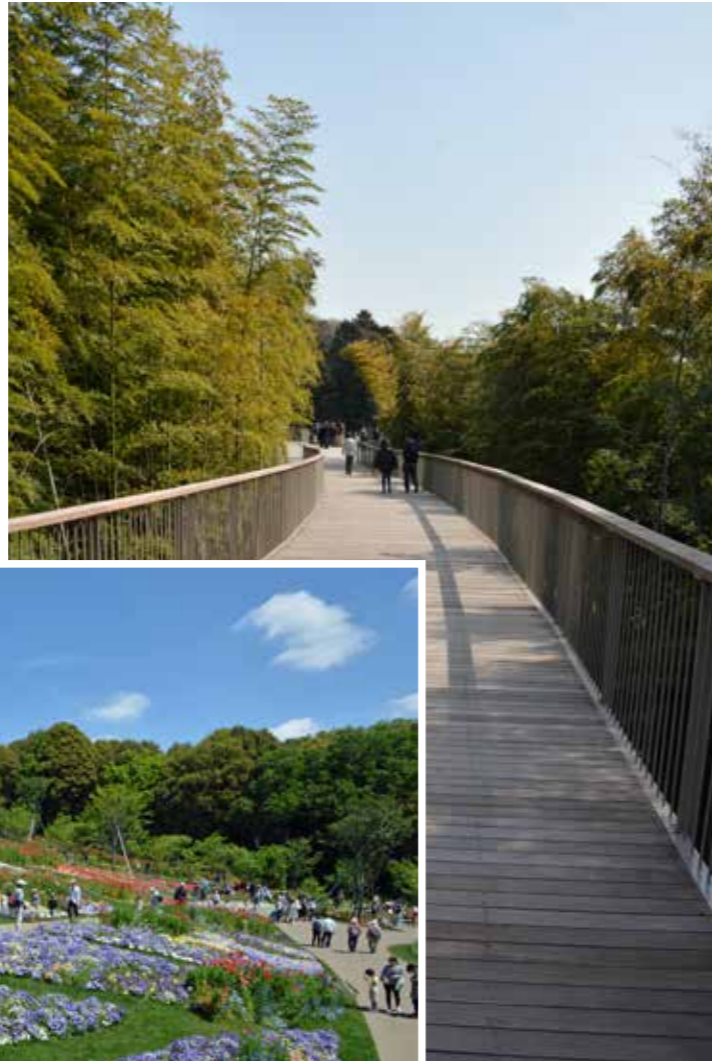
森の空中散歩道で花の見晴らしデッキへ

平成29年(2017)春に開催された全国都市緑化よこはまフェアの会場として整備され、毎年春と秋に期間限定で里山ガーデンフェスタが開催されます。