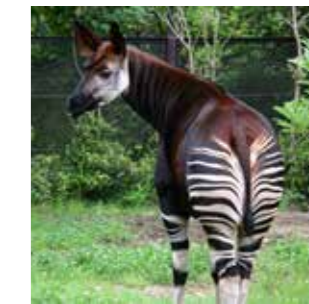
オカピ ズーラシアを代表する 人気動物。