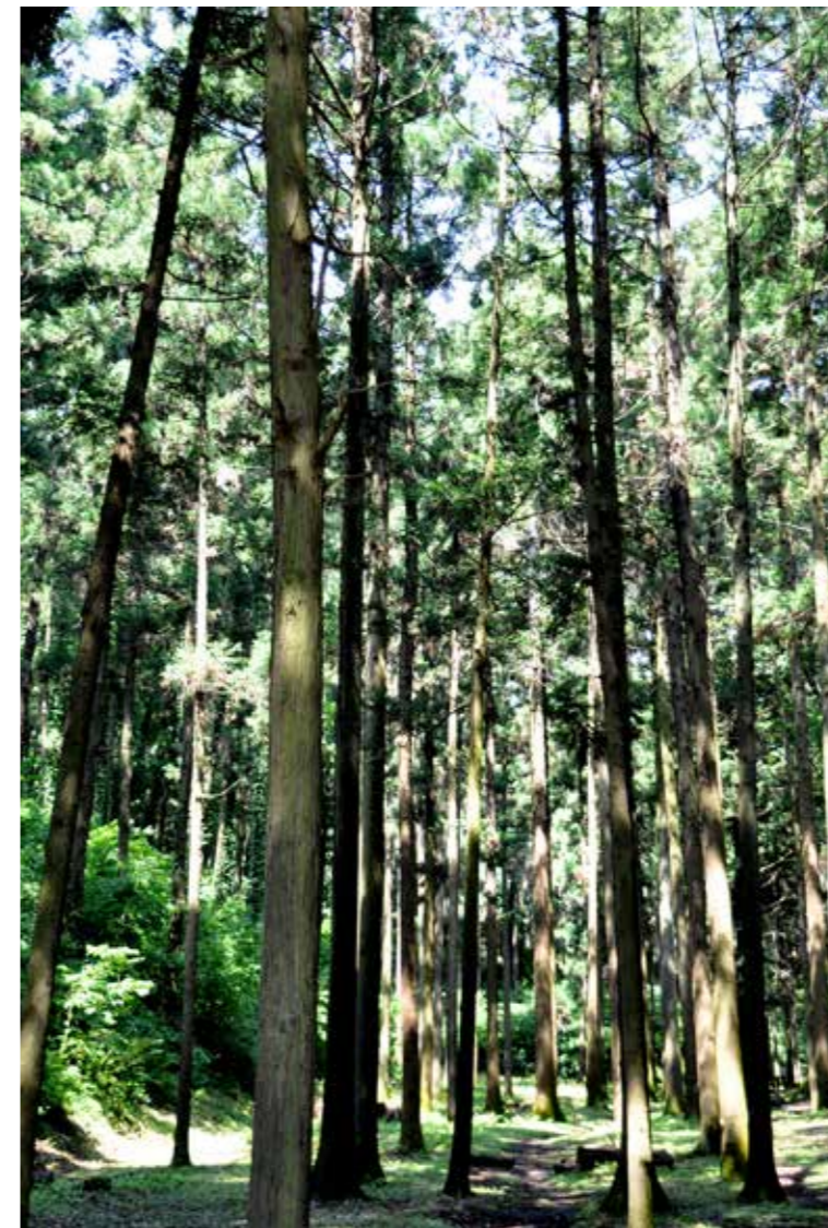
樹林に囲まれた広場のある 追分市民の森