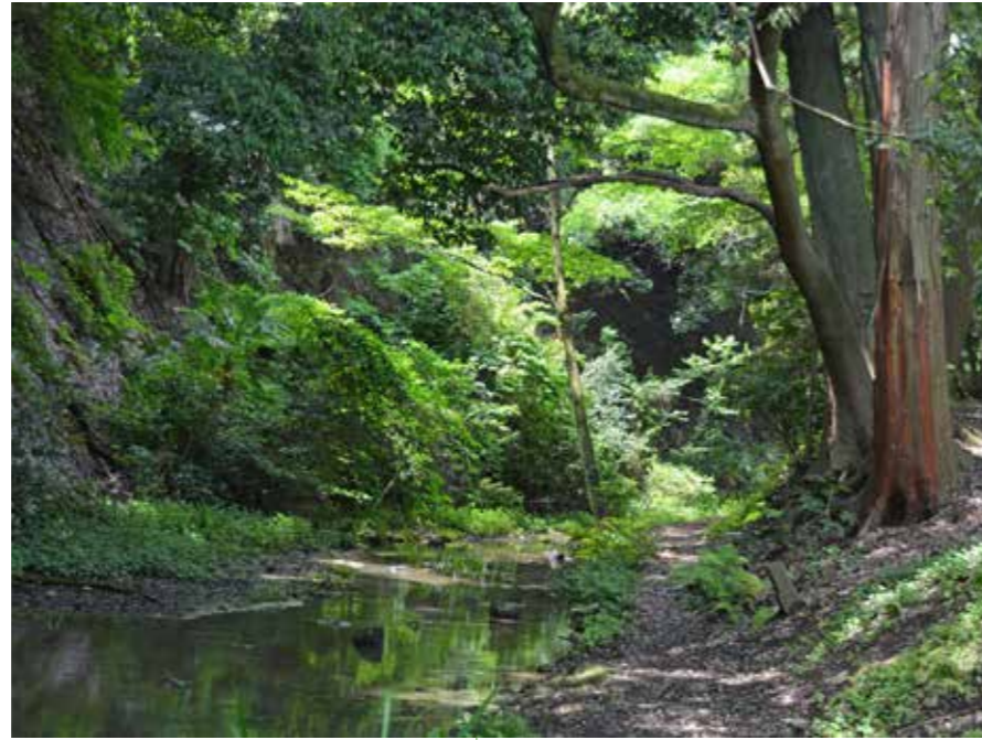
深山のような溪谷

昭和63年(1988)に「水と緑のプロムナード事業」の一環として整備され、平成20年度には都市景観大賞「美しいまちなみ特別賞」を受賞しました。