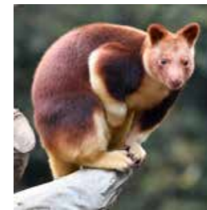
セスジキノボリカンガ ルー 木に登る珍しいカンガ ルー。