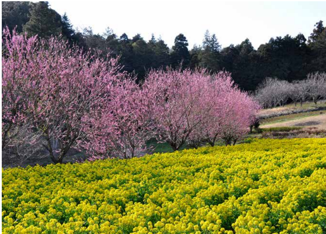
桃や菜の花が咲き競う追分市民の森