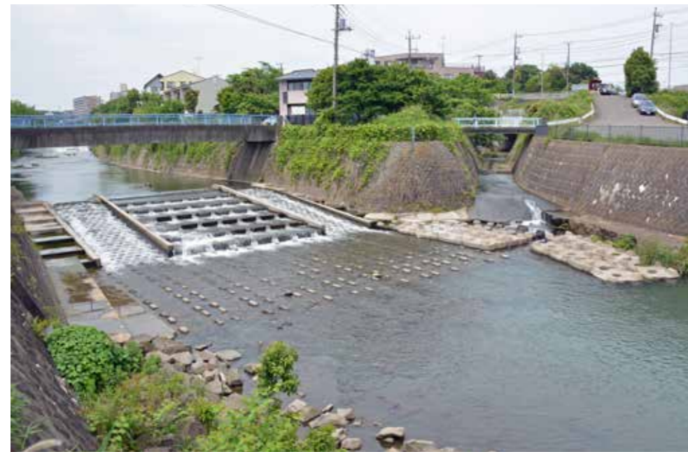
白根からの中堀川と合流