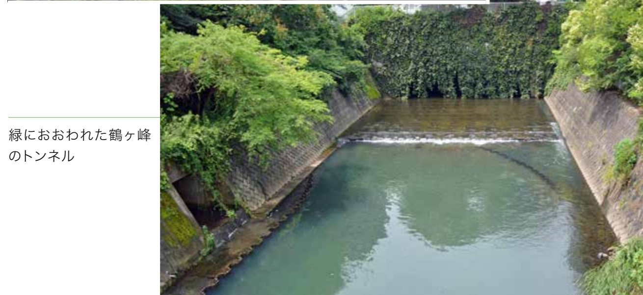
緑におおわれた鶴ヶ峰のトンネル