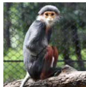
アカアシドゥ克蘭 グール 世界一美しいサルとも いわれる。