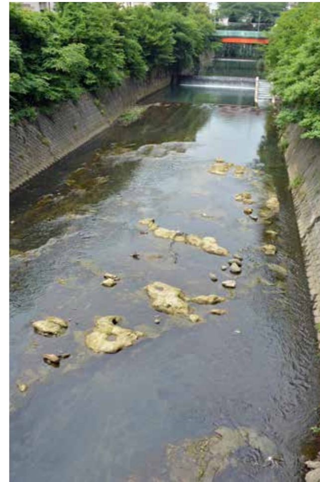
大きな岩が点在する