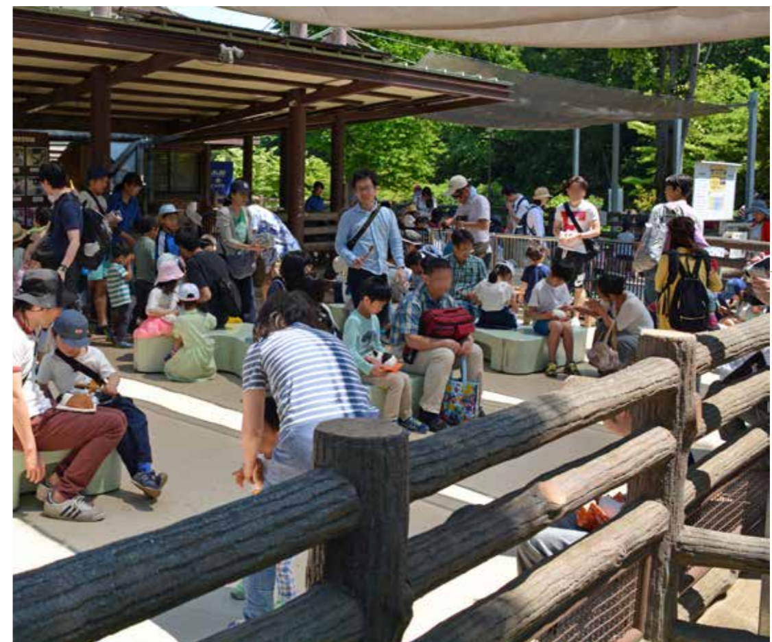
動物にさわれる万騎が原ちびっこ動物園