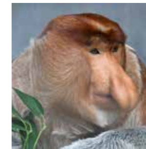
テングザル 天狗のような大きな鼻 が特徴。