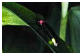
区の木「ドウダンツツジ」