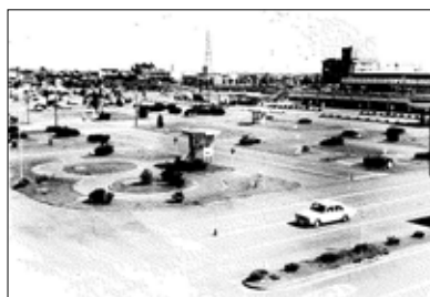
昭和40年代 運転試験場