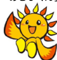
区のマスコットキャラクター 「あさひくん」