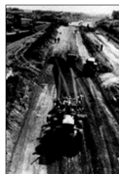
昭和48年(1973) 建設中の保土ヶ谷バイパス