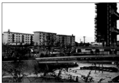
昭和44年(1969) 左近山団地