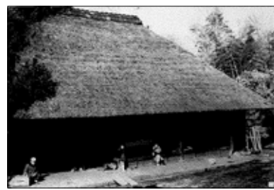
昭和40年代 草葺屋根