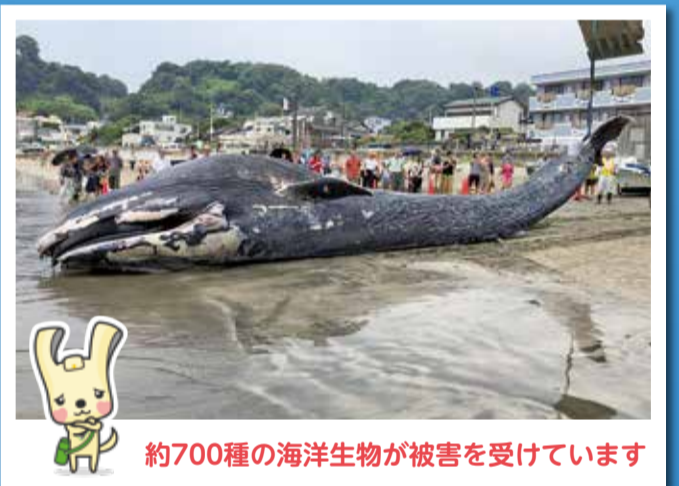
約700種の海洋生物が被害を受けています