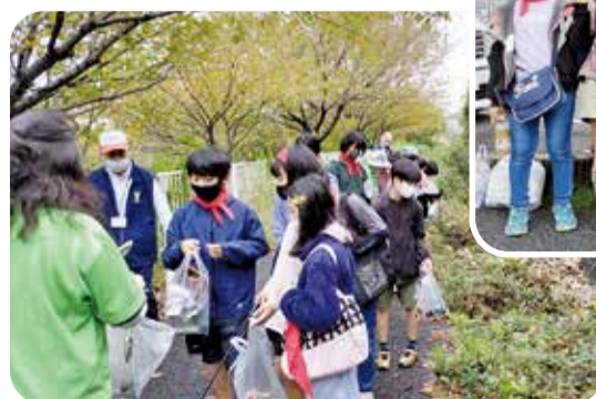
▲旭区では、区内の小学生も街や河川などの清掃活動に取り組んでいます!