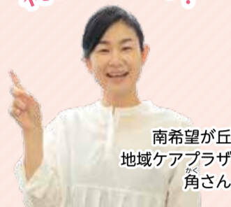
南希望が丘 地域ケアプラザ 角さん

区内に13館ある地域ケアプラザは、赤ちゃんから高齢者まで誰でも利用できるオープンな施設です。いろいろなイベント・講座を開催しているので、参加することで地域のつながりができるかもしれません。「福祉保健の身近な相談窓口」に加えて、ケアプラザでできることを見ていきましょう!