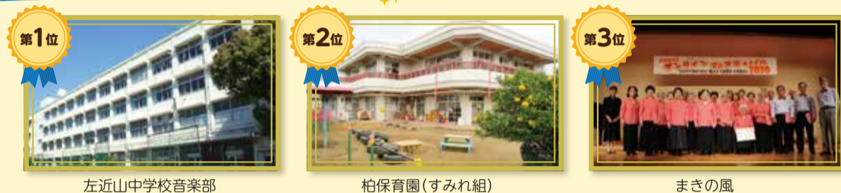
左近山中学校音楽部