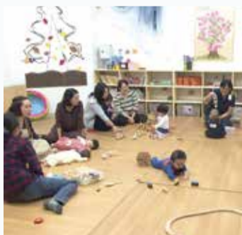
▲わかば親と子のひろば そらまめ

区内に4か所あり、妊産婦さんや乳幼児の親子が遊んだり相談したりできる施設です。一時預かりを行っている施設もあります。