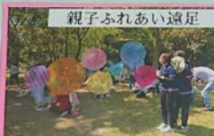
親子ふれあい遠足