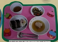
2月のおたんじょうびかい