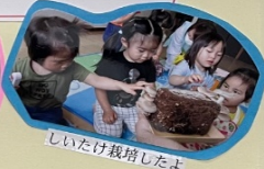
しいたけ栽培したよ