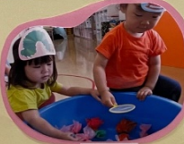
夏まつり きんぎよすくい