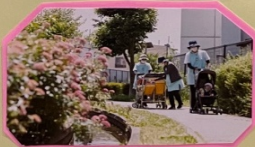
おさんぽにいったよ