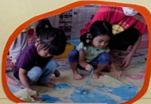
どうもごしの皮で ポディーペインティング