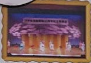
新春発表会 県立音楽堂 1月

季節ごとに楽しい行事がまだまだたくさんあります! 素敵な思い出を一緒に作りましょう!