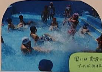
園には常設の プールがありま