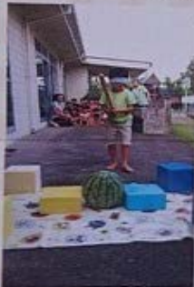
スイカ割り お泊り保育 7月