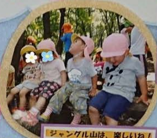
ジャングル山は、楽しいね!

施設の概略 施設名: 鶴ヶ峰保育園 所在地: 〒241-0022 横浜市旭区鶴ヶ峰1-64-1 TEL: 046-373-6523 FAX: 046-373-6549 開設認可: 2004年4月1日 定員: 60名 (0歳児: 6名・1歳児: 10名・2歳児: 11名・3歳児: 11名 4歳児: 11名・5歳児: 11名) 開園時間: (平日) 午前7時~午後5時(延長保育時間を含む) (土曜日) 午前7時~午後6時 入園対象児: 産科病棟/産後日産院/から産科病棟/就学前まで 事業概要: 長時間保育・延長保育(午前7時~午後5時) 一時保育・園庭開放 職員体制: 園長、主任保育士、保育士、栄養士、その他