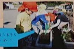
ビーズや ブロック

平づけの心掛け、季節を感じられる旬のものを取り入れ、和食中心の献立に努めています。年齢ごとに食育の年間計画を立て、食材に触れられ、野菜の栽培をしたり、ワークショップを行い、自ら食べ力をつけることを大事にしています。