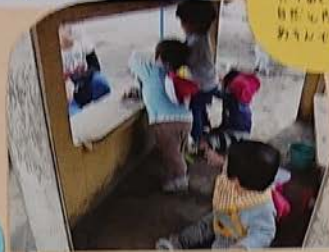
木の園舎で 夏も雨の日 も遊べるよう なっています