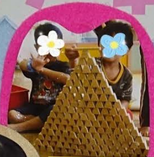
積み木で大きなお塔を作ったよ!

「愛と思いやり」に基づいた保育(養護と教育)により、豊かな可能性を追求しながら、個人愛の社会的実践の場として、地域社会に関わり、共に成長していくことを目的としています。