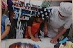
クリスマス パーティー の準備中 です！