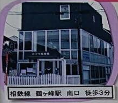
相鉄線 鶴ヶ峰駅 南口 徒歩3分

■子ども一人一人を大切に、保護者からも信頼され、地域に愛される保育園を目指します■