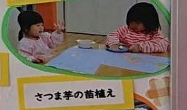
さつま芋の苗植え