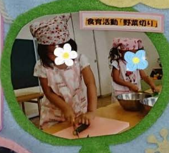
保育活動「野菜切り」

デイリープログラム 7:00 開園 順次登園 9:00 クラス別保育 0,1,2歳児おやつ 11:15 3歳未満児昼食 11:30 昼食 13:00 お昼寝 15:00 おやつ 16:30 順次降園 18:15 夕方のおやつ 18:45 夕食 20:00 就寝 ※土曜日は18:00閉園になります。