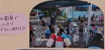
夏は園舎で かいての 遊びもあ りますよ！

乳幼児期には、ワクワクする楽しい体験、子供たちが明日に期待できる活動が大切と考えています。生活や遊びを通して心身を育み、自己肯定感、コミュニケーション能力、社会性を育みます。