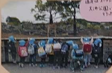
遠足は、おしゃ 天神公園に 行きますよ