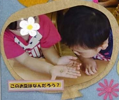
このお豆はなんだろう?

施設の概略 施設名: 鶴ヶ峰保育園 所在地: 〒241-0022 横浜市旭区鶴ヶ峰1-64-1 TEL: 046-373-6523 FAX: 046-373-6549 開設認可: 2004年4月1日 定員: 60名 (0歳児: 6名・1歳児: 10名・2歳児: 11名・3歳児: 11名 4歳児: 11名・5歳児: 11名) 開園時間: (平日) 午前7時~午後5時(延長保育時間を含む) (土曜日) 午前7時~午後6時 入園対象児: 産科病棟/産後日産院/から産科病棟/就学前まで 事業概要: 長時間保育・延長保育(午前7時~午後5時) 一時保育・園庭開放 職員体制: 園長、主任保育士、保育士、栄養士、その他