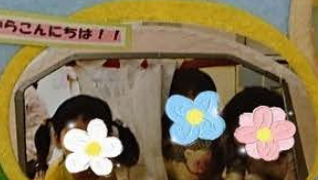
窓からこんにちは!