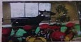
園バスでいろいろな場所に遠足に出掛けます! スーラシア