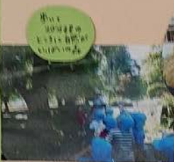
水の上 の砂遊びの 上には青い いぼり傘

元気に遊べることも 自分で表現し、工夫し、考えることも 仲間と共感しあう、心豊かになることも