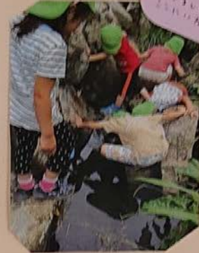
ササガの園舎にも 行きますよ！ こいのぼりも あります！