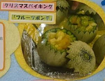
クリスマスバイキング

入園式・進級式・毎月の誕生会 親子遠足・園外保育 内科検診・歯科検診 夏祭り・運動会 お泊まり保育・さつまいも祭り ティーボール大会・卒園式