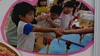
どうもろこしの皮むき