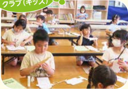
放課後キッズ クラブ(キッズ)