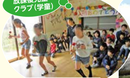
放課後児童 クラブ(学童)