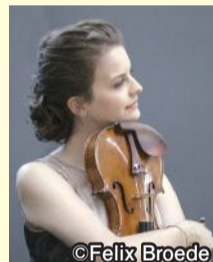
▲ベロニカ・エーベルレ

🕒 9月7日(土) 17時開演 📍 区内在住の人 2組4人(5席5,000円のチケット) ※1組につきチケット2枚 申 必要事項 を明記し、☎でフィリアホールへ。 8月19日(着)抽