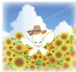
青葉区マスコット なしかちゃん