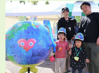
第31回都筑区民まつり