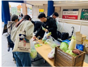
マルシェイベント