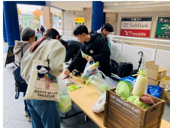
マルシェイベント