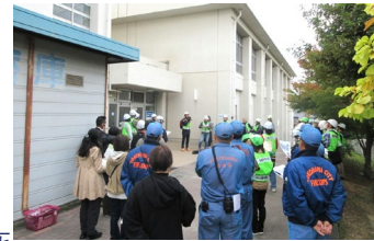
地域防災拠点訓練