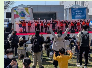
第25回センター北まつり