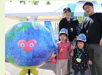
第31回都筑区民まつり