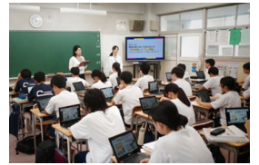
中学校での出前授業