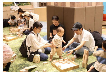
積木遊びの育児講座