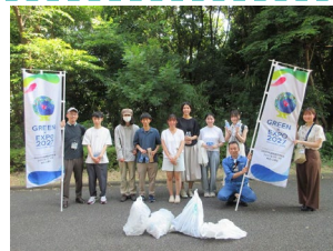
東京都市大学と連携した地域清掃活動