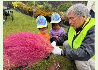
横浜グリーンエクスポ応援イベントHRGコキア祭