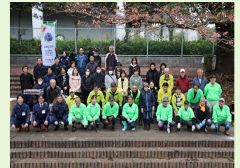
地域の皆様と協力した江川せせらぎ緑道でのチューリップ球根植付

★その他の事業・取組については、令和8年度都筑区個性ある区づくり推進費予算※をご覧ください。