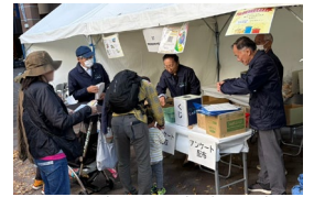
都筑区連合町内会自治会による自治会町内会活動のPR