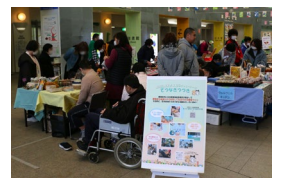
障害者施設自主製品の販売