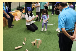
DEI フェスティバルの様子