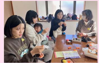
子育て世代と地域の方々が交流する様子