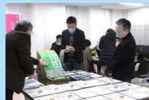
がけ地相談会の様子