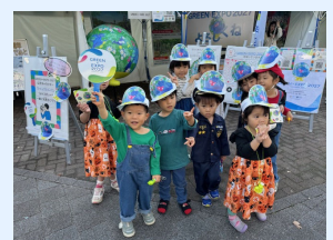
区民まつりでのプロモーション