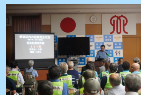
防犯活動のための研修会の様子