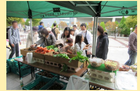
マルシェイベントの様子