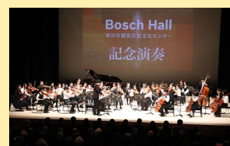
「ボッシュホール」開館記念式典の様子