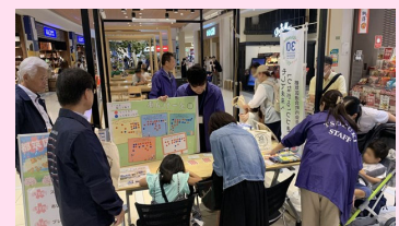
加入促進イベントの様子