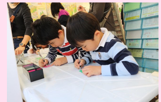
区民まつりにおける ワークショップの様子