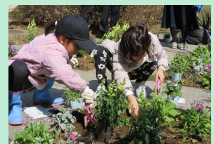
つづき彩りガーデンでの植栽体験