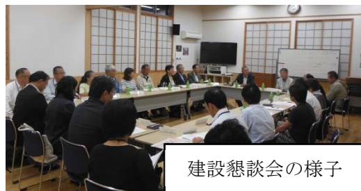
建設懇談会の様子