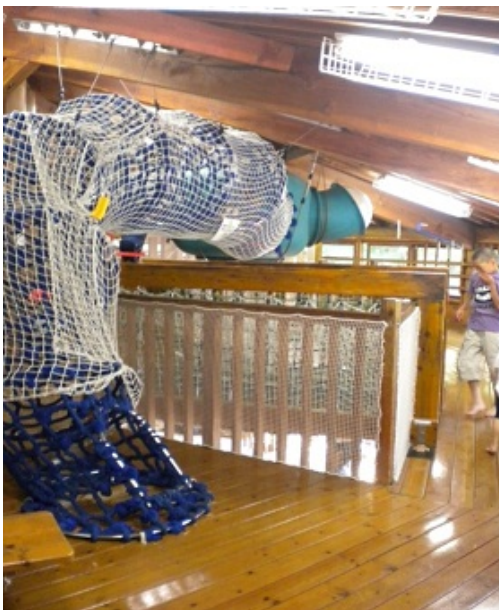
◇中の様子 (2階) 4