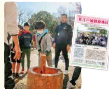
三代交流会餅つき