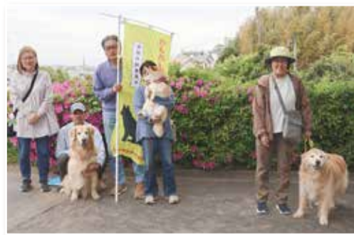
わんわんパトロール会の皆さま

いつもの犬の散歩に防犯パトロールの要素を取り入れた活動を行っています。2026年4月末現在で、約100人が参加しています。