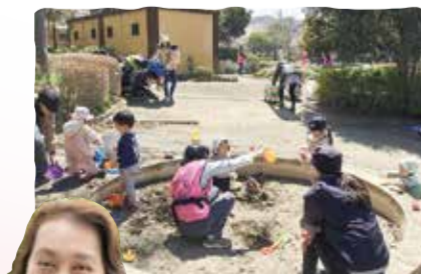
はやぶち公園であそぼう~