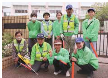
見守り隊の皆さま

各々が自宅近くのポイントに立って、見守り活動を行っています。約20年前から本格的に活動を開始し、2026年4月末現在で16人が登録しています。