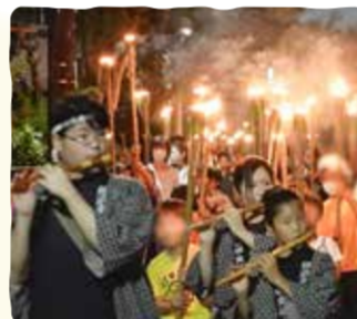
横浜市指定無形民俗文化財 南山田の虫送り

「ヨイヨイ」のかけ声と200本の松明を手に練り歩き、江戸時代から続く伝統の舞とお囃子を子どもたちへ引き継いでいます。「御焚上の灯のように未来を照らしてほしい!」そんな願いで地域の行事を守っています。