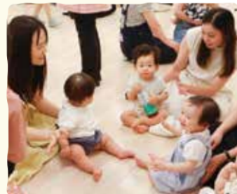
0歳児親子を対象とした赤ちゃん会