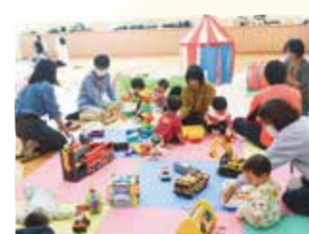
都田地区子育てサロン

古くから都田村として、農業を中心に暮らしてきた地域。野菜も思いやりも分け合い、気軽に声をかけ合って、「都田ってあったかいじゃ〜ん」の関わりづくりを大切にしています。「子育てサロン」や「みやこちゃんおしゃべりサロン」など、心地よい距離感で知り合う取り組みを進めています。