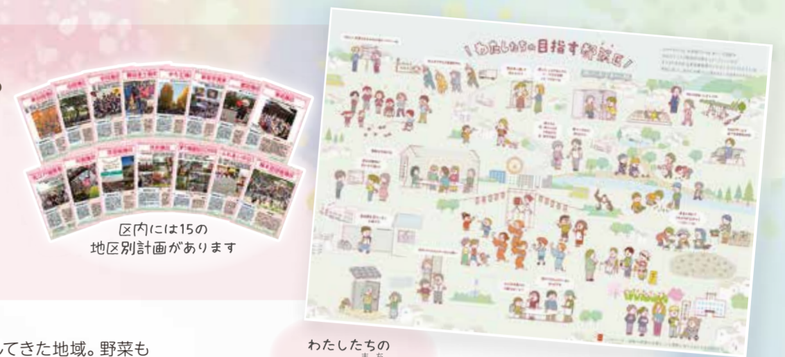
区内には15の地区別計画があります