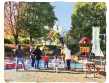
今日どこいく? (旧:外あそびいく)

きっかけは、子どもと参加した防災訓練。「やってみようかな」の一歩が、世代を超えた出会いや地域を知る機会となり、今の充実した時間につながっています。「今日どこいく? (旧:外あそびいく)」では、地域の素敵な遊び場を紹介しています!