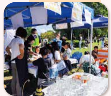
＼ 地域の人と一緒に！ / ハロウィンイベント