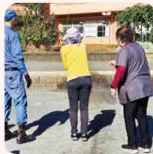
地域防災訓練に参加

地域のイベントにグループホームの入居者が参加したり、グループホーム主催のイベントに地域の人に参加するなど交流しています。また、入居者や地域の人に参加する地域連携推進会議を行い、地域との関係づくりを進めています。