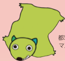
都筑区民活動センター マスコットキャラクター 「モモちゃん」

区民活動センターでは「何かを始めたいけれども何がやりたいのかまだわからない」「こんなことがやりたいけれども1人で始めるのはちょっと…」と地域活動の一步を踏み出せない人たちを後押しする「大人の部活動」という事業があります。