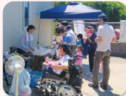
＼ 地域の人と一緒に！ / ブルーベリー狩り