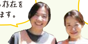
おひさまコーディネーター