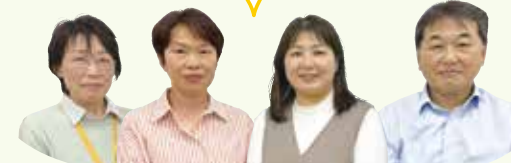
日曜おひさま広場協力者

お子さんたちからパワーをもらっています。お子さんたちの成長に立ち会えてうれいです。