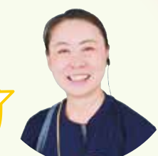
放課後キッズクラブスタッフ

元気な子どもたちにこちら も元気をもらっています! わたしたちに安心して 預けてください。