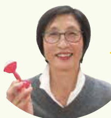
こんにちは赤ちゃん訪問員

生後4カ月までの赤ちゃんがいる家庭を対象に、地域の訪問員が家庭を訪問し、子育てに関する情報提供を行い、子育てを応援します。訪問時には、赤ちゃんにおもちゃのプレゼントも。