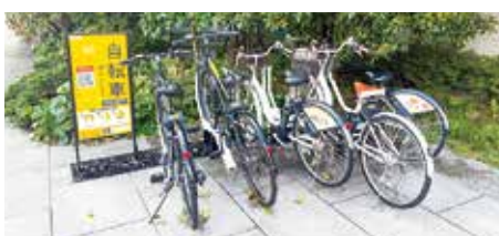
区役所に新たに設置されたポート

4月から、シェアサイクルがさらに便利になっています。都筑区役所にも新たにポートが設置されたほか、今後都筑区内でも順次ポートが設置される予定です。使いやすくなったシェアサイクルをぜひご利用ください。