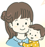
子育てサロンに 参加した保護者