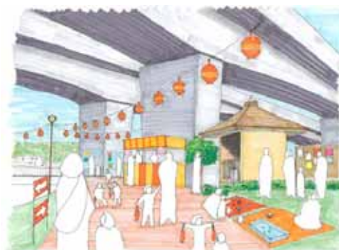
歩行者空間を活用した子育てイベント (No.16)