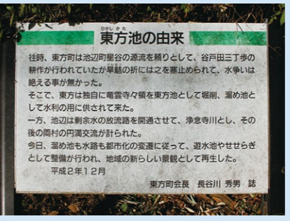
東方池 由来の説明板

昔、見花山周辺を源流とする川は、池辺町星谷の辺りを通って真照寺方面に流れており、東方はこの川を頼りに耕作を行っていたが、干ばつの際に上流でせき止められてしまい、水争いが絶えなかった。そこで、用水に困った東方は、独自に龍雲寺の土地に東方池を掘り、この池の水を灌漑用水とした。一方、池辺は、余剰水の放流路を開通させて、浄念寺川として水路を造り、2つの村の水争いはなくなった。平成2年には、大雨時に水を溜める雨水調整池として再整備された。