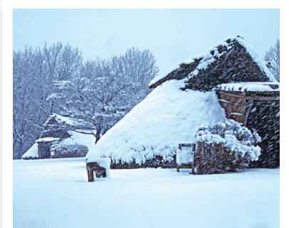
大塚・歳勝土遺跡 古代の雪景色 ※2

都筑区域の人びとは、大昔から豊かに暮らしてきました。 そんなまちの歴史を知ってみませんか?