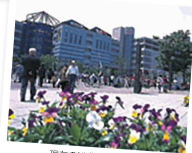
現在の港北ニュータウン

平成28年3月に「都筑区まちづくりプラン」を改定します。 都筑区の今後について考えてみませんか?