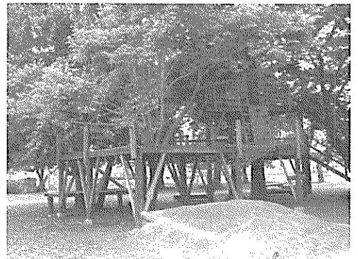
緑野青空子ども広場ツリーガーデン(大和市)

した。子どもたちに好きな遊びをさせる。そこには必ず危険が伴い、ケガもするだろう。すべてを保護者に説明し、理解を得て、自由に使わせている。常に責任が問われ、訴訟があたりまえの社会で、このような運営をしているすばらしさを感じました。