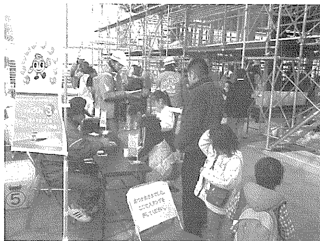
都筑ふれあいの丘駅

今回広報の取材として参加させていただき、原稿作成は別として、楽しむことができました。スタッフ側の中