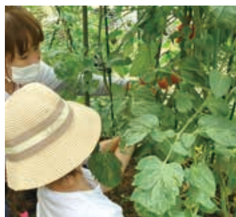
自分で育てた野菜はちょっと特別! 苦手な子どもも興味を持って収穫します