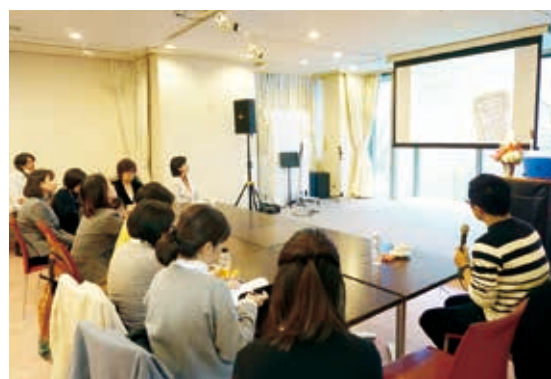
あっとほーむカレッジを卒業した方にも、 事業の継続や仲間づくりのサポートをしています