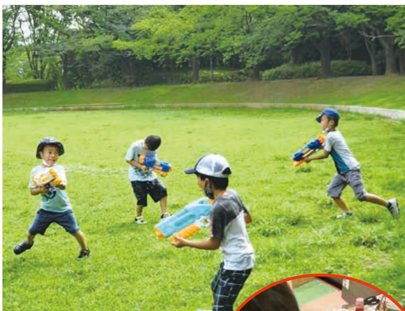
夏休みは水鉄砲でびしょ濡れになるまで遊びます

残業やシフト勤務、出張など保護者の働き方に柔軟に対応した、お迎え付き夜間保育や学童保育を行っています。一軒家を利用し、手作りのご飯やお風呂など家庭と同じ温かな雰囲気、少人数を対象とした保育サービスを提供しています。保育を担うだけでなく、女性の活躍支援として「仕事と子育ての両立」や「起業」をテーマにしたセミナーも開催しています。また、子育て支援者の育成にも力を入れており、起業講座「あっとほーむカレッジ」では、自分の地域で同じような子どもたちの居場所を作りたいと考えている方々のお手伝いをしています。