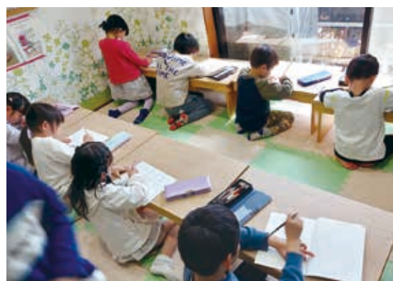
宿題サポートでは1年生も集中して勉強しています