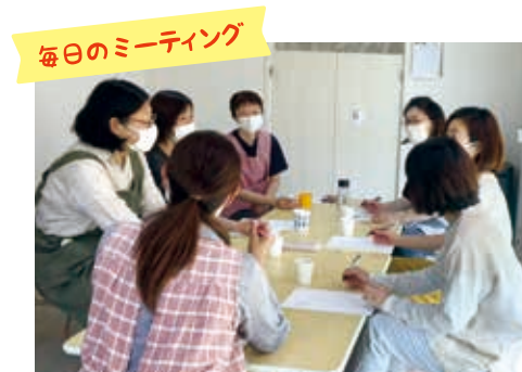
毎日のミーティング