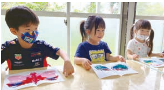
「楽しい」と感じる活動で集中力が高まり、先生のお話も上手に聞きながら、成功体験を積み重ねます