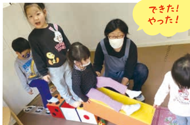
経験豊富なスタッフが子ども同士の関わりを繋げ、一人ひとりに寄り添った支援をしています