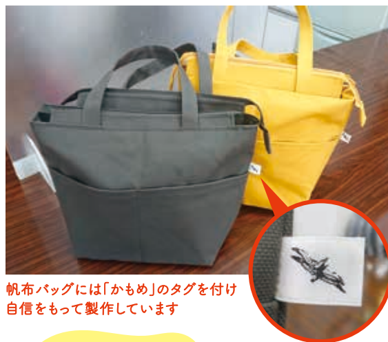
帆布バッグには「かもめ」のタグを付け 自信をもって製作しています