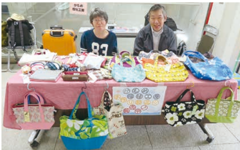
毎月1回第2金曜日に都筑区役所1階で販売しています

障害のある方たちによるハンドメイド製品づくりや販売を通じて、自立支援を行っています。昭和56年に緑区(現青葉区)美しが丘に作業所を設置したのが始まりです。通所される方が安心して働けることを心がけながら、「正確・丁寧・安全」にオリジナル布製品を製作・販売しています。また、日常的な作業だけではなく、自分たちでイベントを企画し、仲間とのふれあいを大切にしたサークル活動の充実にも力を入れています。また、イベントやマルシェへの積極的な出店や、ハマロードサポーターの一員として清掃活動など、地域の方々との交流も図っています。