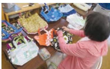
得意とする作業をメンバー全員で 協力しながら製作します