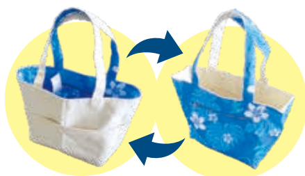
帆布素材を使ったリバーシブルバッグは リピーターが多く人気です