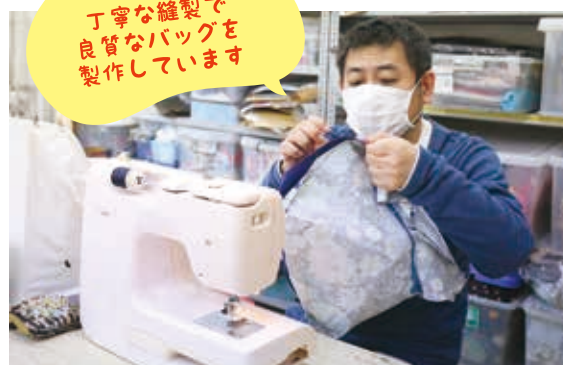
丁寧な縫製で 良質なバッグを 製作しています