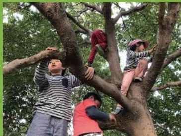
木登り名人、たくさんいます!