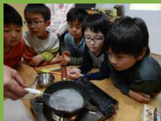
べっこう飴づくりに挑戦!