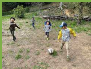
楽しさ至上主義! もあなFC