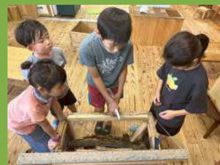
夏に向けて虫かごの準備!

放課後児童クラブ「もあなのいえ」では、 子どもたち一人ひとりの 「やりたい」という気持ちを大切にしています。