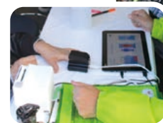
メディカルアナライザー (血管年齢測定器)