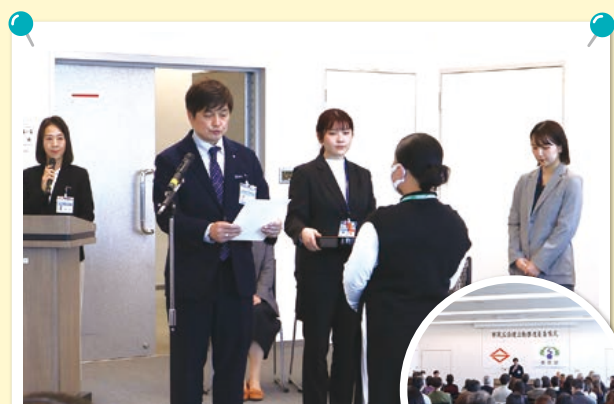
中山センター長から 委嘱状を受け取りました

現在124名が活動中です。任期は令和7年4月 1日から令和9年3月31日までの2年間です。