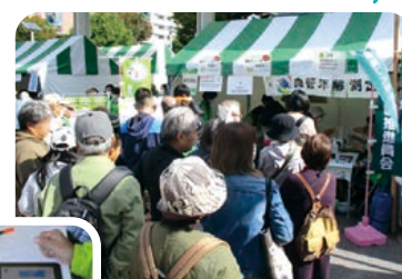
測定待ちの長い行列

血管年齢測定、握力測定は 今年も大人気！みなさんの 健康をチェックするとともに 日頃から健診を受ける ことの大切さも伝えました。