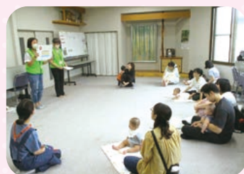
グループホームでの健康チェック会