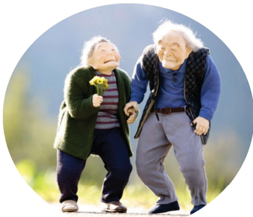
「いっしょに帰ろう」高橋まゆみ 作