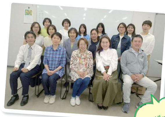
地域の 子育て応援団!

私たち主任児童委員は、子どもや子育てに関する支援を専門に担当する民生委員・児童委員です。相談内容に応じて、その地域を担当する民生委員・児童委員や行政機関、学校、児童相談所などと連携し、地域の身近な相談相手として子どもや子育てに関する支援活動を行っています。