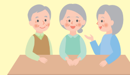
サロン・居場所づくり