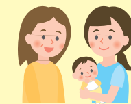
子育て・子ども支援