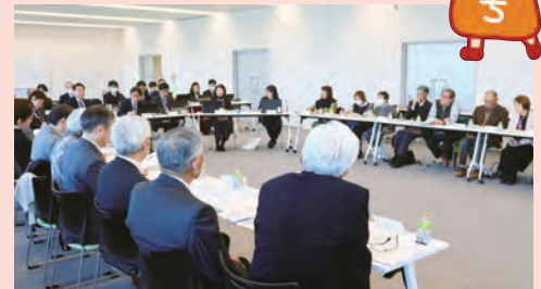
推進委員会の様子(令和6年12月)