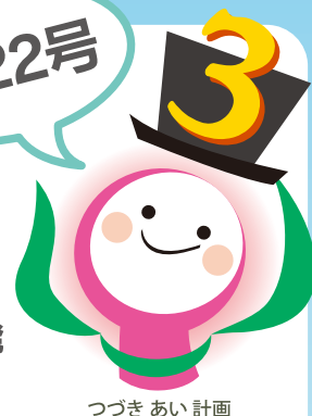
つづき あい 計画