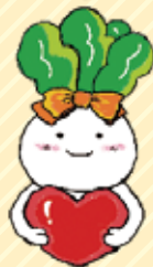
都田地区 地域福祉保健計画 キャラクター 小松菜hairの みやこちゃん