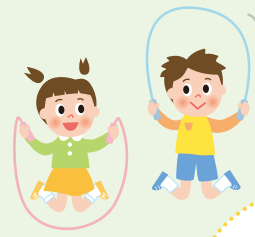
外遊びは楽しいよ! 公園でみんなで 一緒に遊ぼうよ