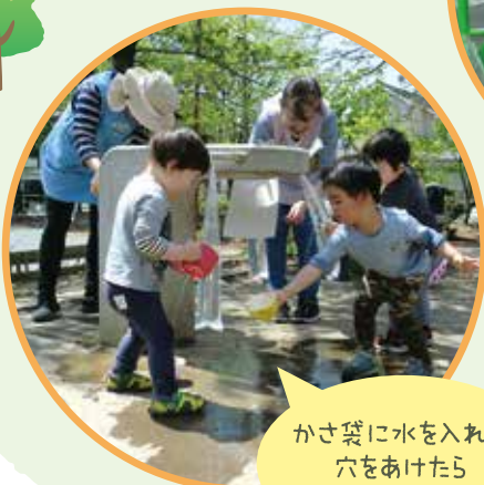
かさ袋に水を入れて 穴をあけたら 手作りミスト完成