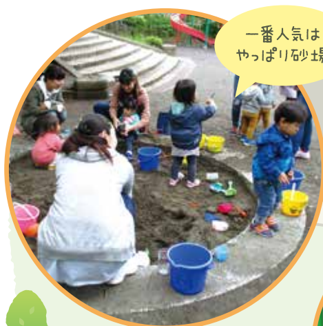
一番人気は やっぱり砂場

子ども達の笑顔は、ママの笑顔♪ 大好きなお砂場あそび、水遊び♪ 公園だから出来る事をおもいつ くりたのしもう! をモットーに、毎月第一木曜日に開催しています。主任児童委員を中心に、民生委員 や親と子のつどいの広場「すくすくサロン」のスタッフも毎回参加している、外遊びを楽しみながら情 報交換ができる場です。