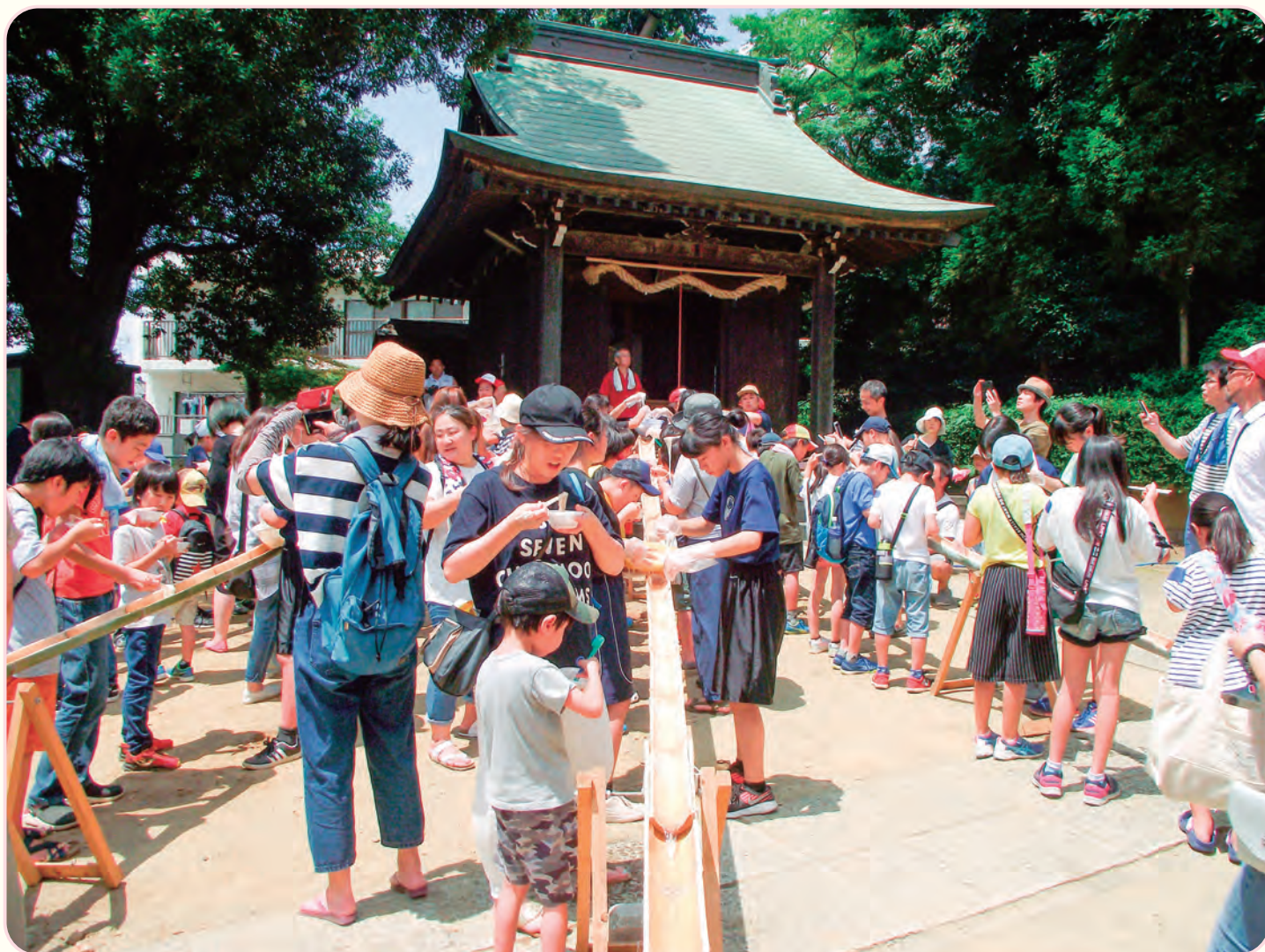
夏休みの工作とそうめん流し