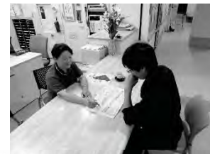
福祉・保健の専門職による相談