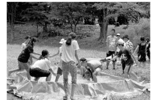
地域の方との交流