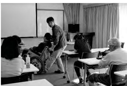
ボランティア交流会車椅子講座の様子