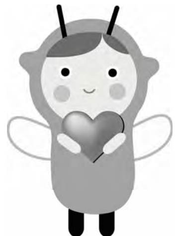
都筑区社会福祉協議会 キャラクター「ゆいピー」