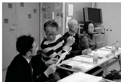
ボランティア交流会グループワークの様子