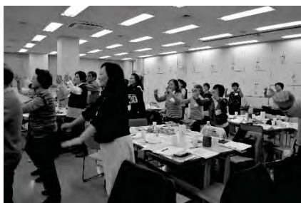
ボランティア交流会の様子