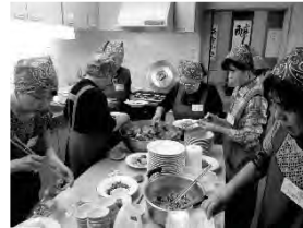
調理ボランティア