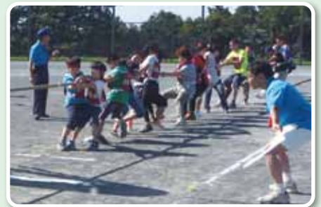
川和連合体育祭 10月