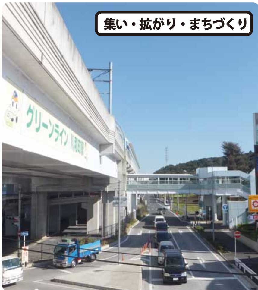
横浜地下鉄グリーンライン川和町駅と川和市民の森