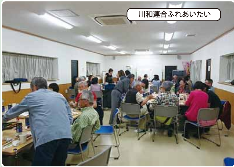
川和連合ふれあいたい

平成26年に発足した見守り・声かけ活動組織 (写真は平成27年4月に開催されたボランティア登録会員のサロン)