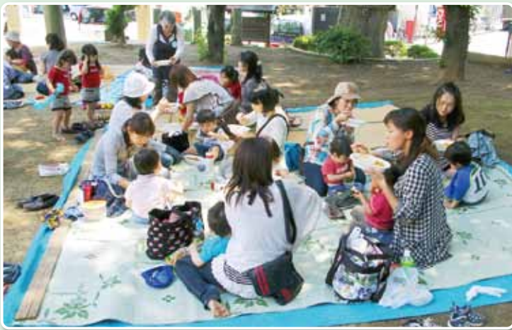
杉山神社・連合会館で遊ぼう

できる人ができる範囲でお手伝いをするボランティアの会「ささえ あいいけべ」で、誰でも気軽に地域活動に参加できる仕組みをつくっています。