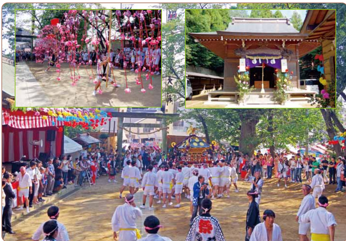
杉山神社のお祭り