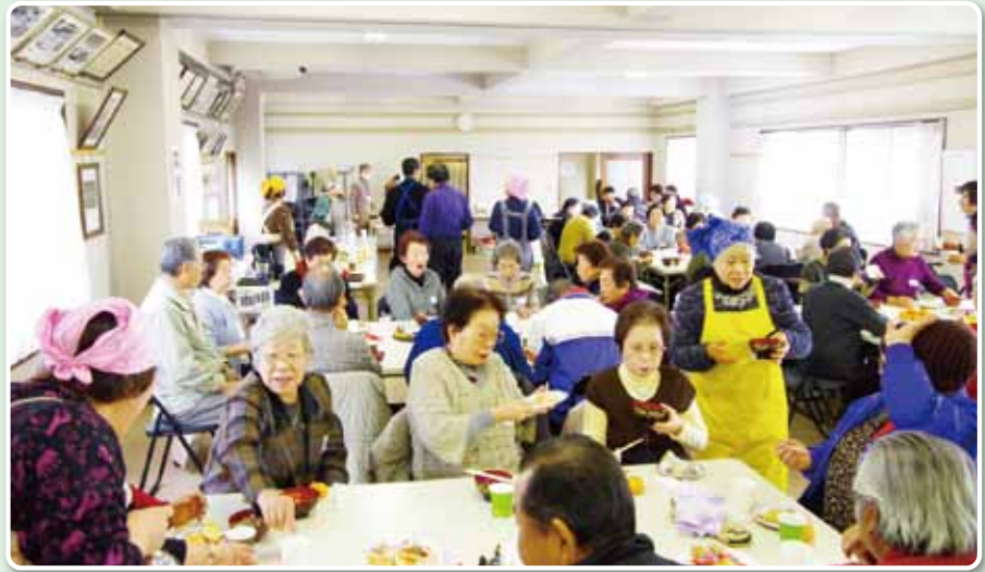
地域サロン「ささえあいいけべ」