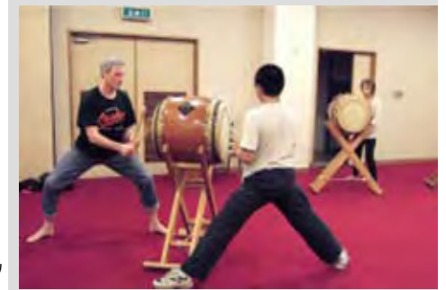
ひだり 左ガジョンさん