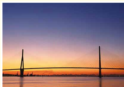
海のまち「鶴見つばさ橋」