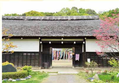
丘のまち「横溝屋敷」