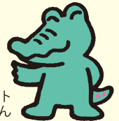
鶴見区のマスコット ワックン