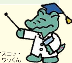
鶴見区のマスコット ワックン