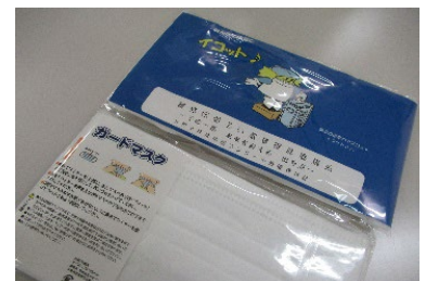
▲明るい選挙啓発物品への使用例 最優秀作品をプリントしたマスク