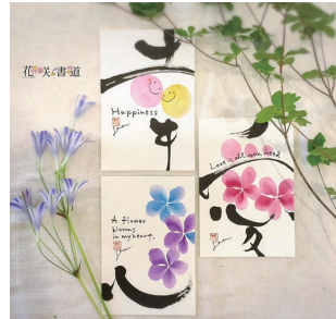
花と笑顔の書道を体験しよう

①思いを伝える 花咲く書道▶書になじみがなくても、絵が苦手でも大丈夫 5月18日(土)10時~12時 成人 先10人 ¥500円 持 筆記用具 申4月12日9時30分から 窓 ☎