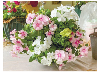
バスケットの前面にも花が並びます

①空間を華やかに彩る 英国式ハンギング 5月26日(日)10時~12時 成人 抽6人 ¥2,500円 ※ハンギングバスケットがない人は別途1,200円 持 エプロン、手袋 申4月14日10時から 窓 (☎は13時から)