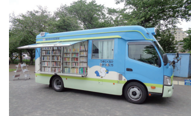
巡回状況などはウェブまたはX(旧ツイッター)で