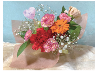
感謝の気持ちを花と一緒に贈ろう

①母の日のフラワーアレンジメント 5月12日(日)10時30分~12時 先8人 ¥880円 申4月12日9時30分から 窓