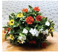
バスケットの前面にも花が並びます