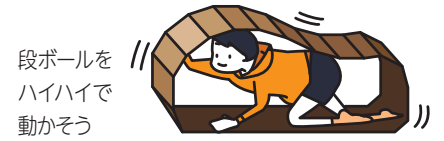
段ボールをハイハイで動かそう