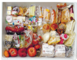
収集で燃やすごみの中から見つけた「手つかず食品」の一例