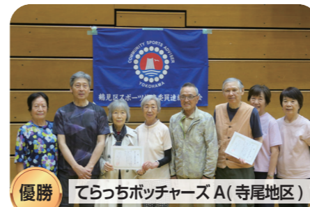
優勝 てらっちボッチャーズ A(寺尾地区)