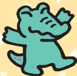
鶴見区のマスコット ワックン