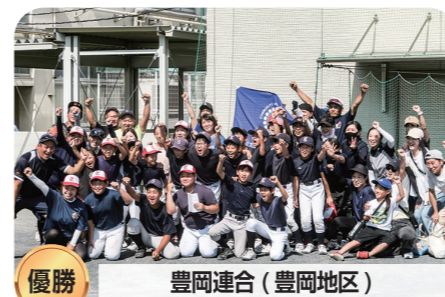
優勝 豊岡連合(豊岡地区)