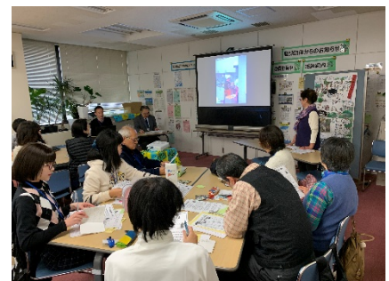
第3講での発表の様子

現在は潮田地域ケアプラザを拠点に、パソコン教室や「おたすけまん」と称する手助けボランティアの活動も行っています。