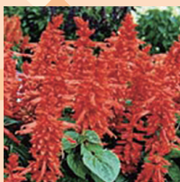
Sálvia, a flor dos habitantes