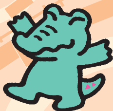
Wakkun, a mascote do subdistrito