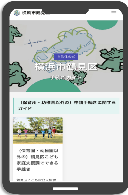
スマホ画面イメージ

鶴見区では、保育所等の利用や児童手当の申請、ひとり親家庭支援など、こども家庭支援課の窓口で取り扱う手続きについて、事前にオンラインで簡単に調べられる「手続きガイド」を新たに導入します。